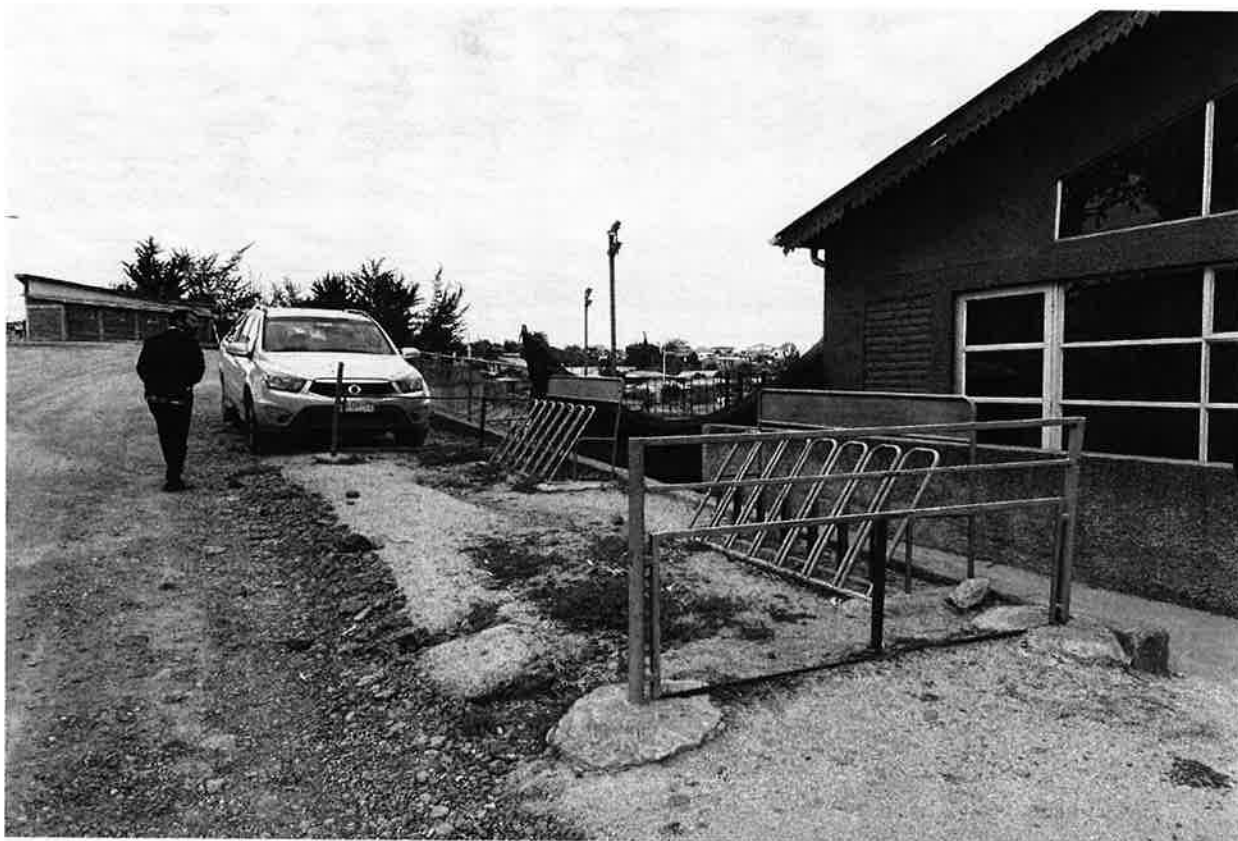
Imagen Terreno de Proyecto: "Construcción baranda y pasamanos Plaza de armas, Comuna de Litueche".