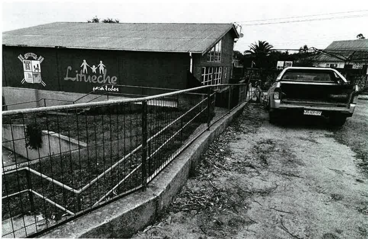
Imagen Terreno de Proyecto: "Construcción baranda y pasamanos Plaza de armas, Comuna de Litueche".

ILUSTRE MUNICIPALIDAD DE LITUECHE Secretaría de Coordinación y Planificación Comunal