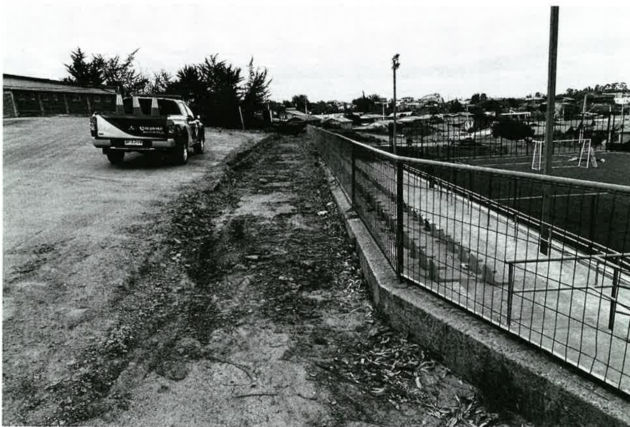
Imagen Terreno de Proyecto: "Construcción baranda y pasamanos Plaza de armas, Comuna de Litueche".