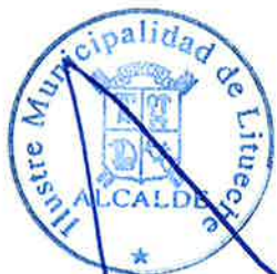
RENÉ ACUÑA ECHEVERRÍA ALCALDE

El contrato será liquidado por La Unidad Técnica una vez tramitada totalmente la Recepción Definitiva de la Obra, de acuerdo al artículo N° 55 de las Bases Administrativas Generales.