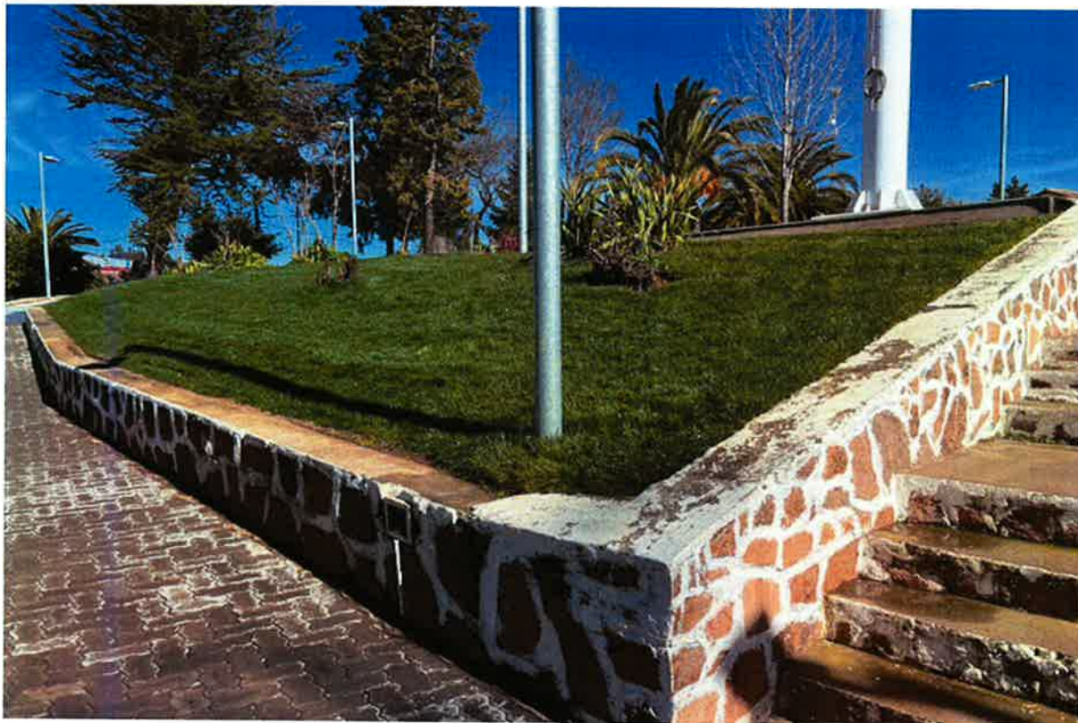
Imagen Terreno de Proyecto: "Construcción Letras Volumétricas Plaza de Armas, Comuna de Litueche".

ILUSTRE MUNICIPALIDAD DE LITUECHE Secretaría de Coordinación y Planificación Comunal