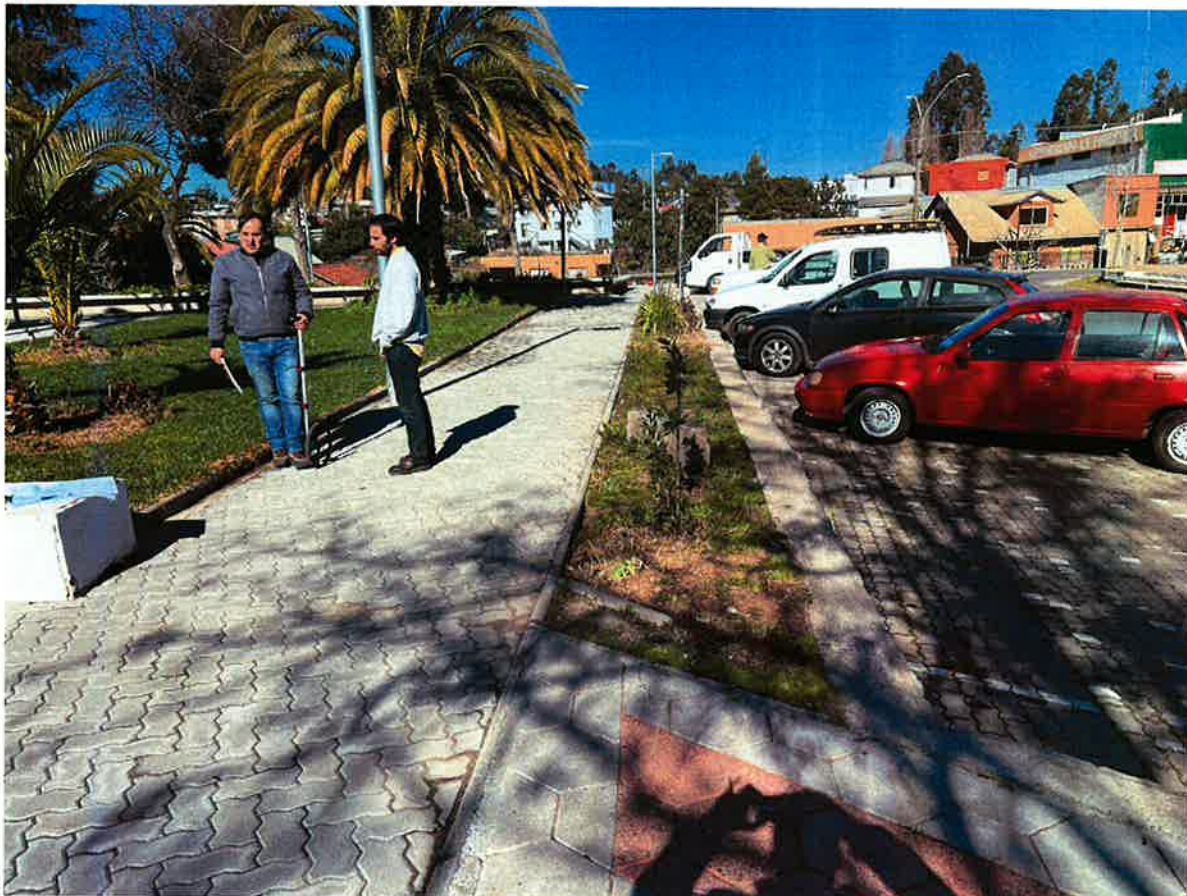
Imagen Terreno de Proyecto: "Construcción Letras Volumétricas Plaza de Armas, Comuna de Litueche".

ILUSTRE MUNICIPALIDAD DE LITUECHE Secretaría de Coordinación y Planificación Comunal