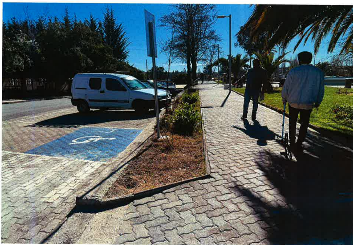
Imagen Terreno de Proyecto: "Construcción Letras Volumétricas Plaza de Armas, Comuna de Litueche".