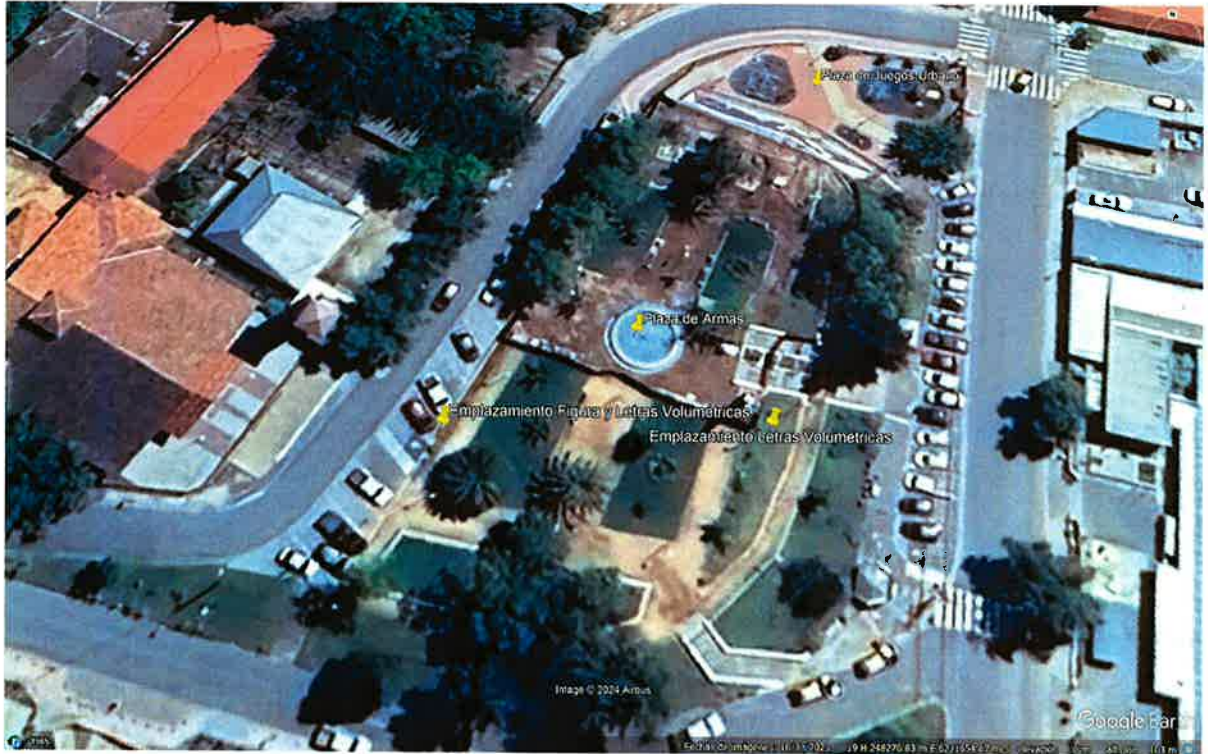
Imagen Georeferencial Terreno de Proyecto "Construcción Letras Volumétricas Plaza de Armas, Comuna de Litueche".

ILUSTRE MUNICIPALIDAD DE LITUECHE Secretaría de Coordinación y Planificación Comunal