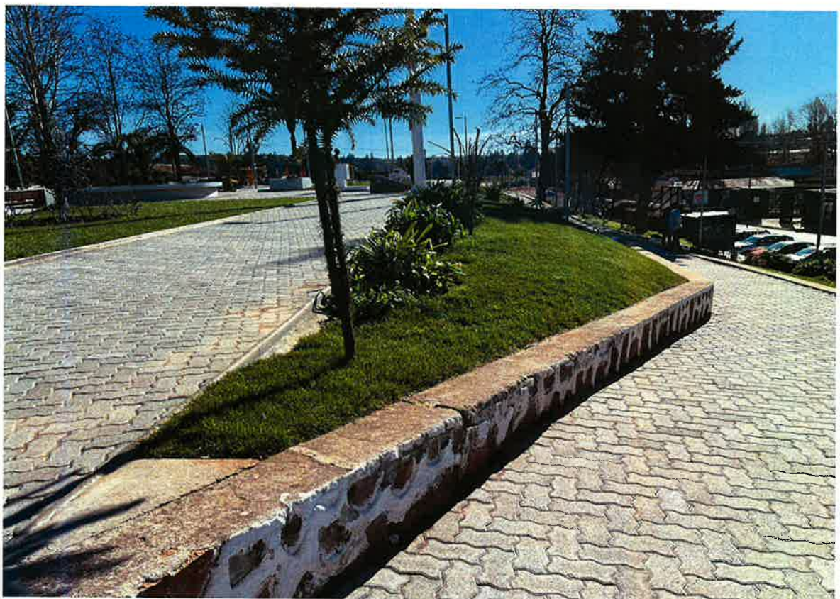
Imagen Terreno de Proyecto: "Construcción Letras Volumétricas Plaza de Armas, Comuna de Litueche".

Coordenadas UTM 248192.00 m E - 6221663.00 m S