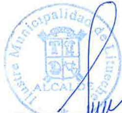
RODRIGO PALOMINOS VIDAL Alcalde

DECIMO: Se hace extensivo el cumplimiento íntegro del presupuesto del Programa de actividades recreativas de verano e invierno municipal.