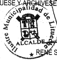
★ RENE SANTIAGO ACUÑA ÉCHEVERRÍA Alcalde