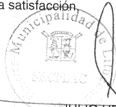
JULIO URRUTIA ALIAGA Secplac Municipal