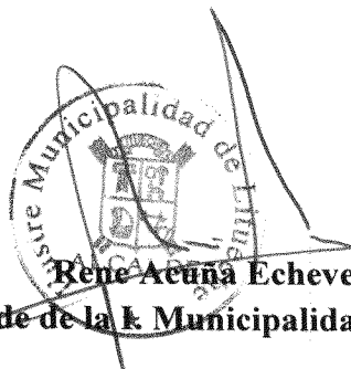
Rene Acuña Echeverría. Alcalde de la I. Municipalidad de Litueche