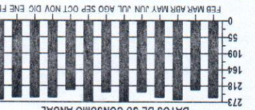
DATOS DE SU CONSUMO ANUAL

Fecha estimada próxima lectura : 26/03/2014