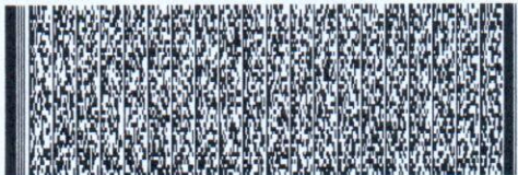
Timbre Electrónico SII - Res. N° 139 del 16-11-2007

** SUSPENSIÓN A PARTIR DEL 20/02/2014. Por deuda de consumo eléctrico, Boleta 39618234 Valor de la suspensión y reposición, $ 13.253.- (aprox.). Valor regulado.