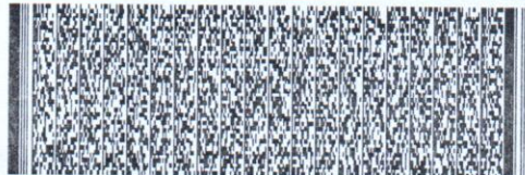
Timbre Electrónico SII - Res. N° 139 del 16-11-2007