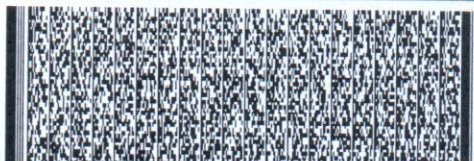
Timbre Electrónico SII - Res. N° 139 del 16-11-2007