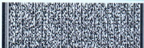
Timbre Electrónico SII - Res. N° 139 del 16-11-2007