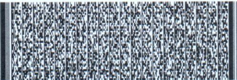
Timbre Electrónico SII - Res. N° 139 del 16-11-2007