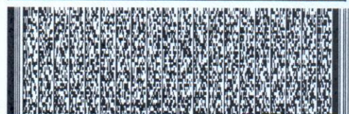
Timbre Electrónico SII - Res. N° 139 del 16-11-2007